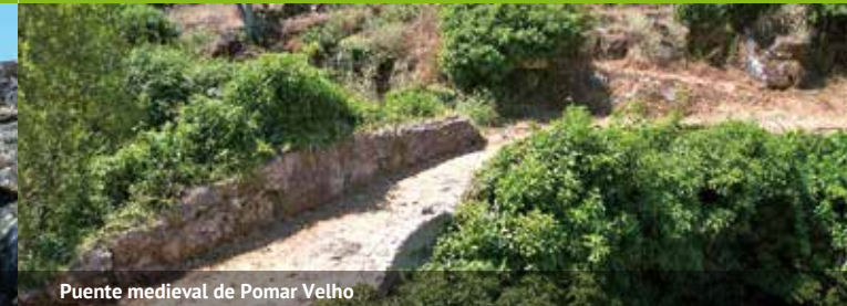
Puente medieval de Pomar Velho