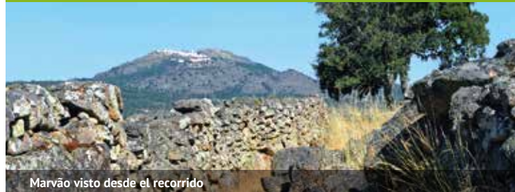
Marvão visto desde el recorrido