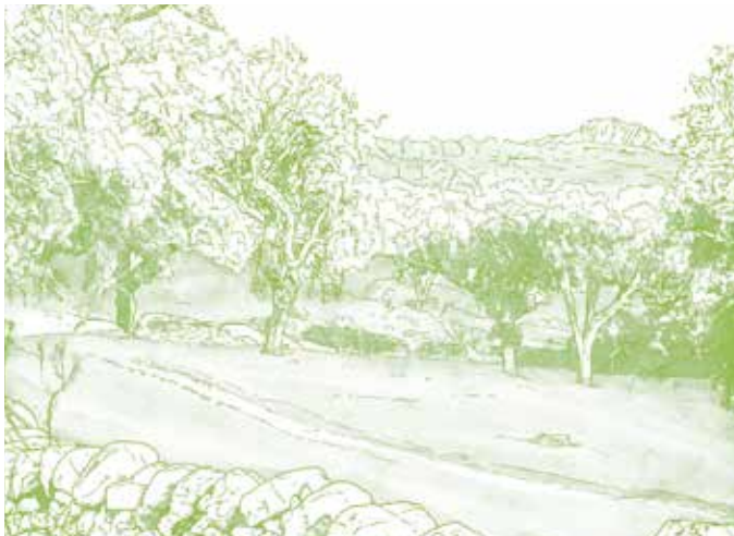
Alcornocal. Este recorrido cruza una de las mejores zonas de alcornocales del Parque Natural de la Sierra de São Mamede.

Desde el inicio, a pesar del relieve irregular del paisaje, se pone de manifiesto que este es el reino del alcornoque. Bosques casi repletos de estos árboles, sólo interrumpidos por los afloramientos graníticos y por los valles aún cultivados, que nos acompañan en casi todo el recorrido. A lo largo de este paseo, un conjunto de 3 pequeñas poblaciones fronterizas, Galegos, Monte de Baixo y Pitaranha, sugieren una estrecha complicidad con su congénere española, La Fontañera, zona por donde los contrabandistas recibían el café. Estrechas y sinuosas veredas, a veces de empedrado medieval, ladeadas de muros y escondidas en la sombra de frondosos alcornocales fueron en otros tiempos caminos de contrabandistas. Ahora, nos llevan por los mismos paisajes pero por otras aventuras. Al subir hacia Pitaranha comenzamos a ver el cerro del castillo de Marvão. Cerca de la aldea conseguimos ver parte de la sierra de Porto de Roque, una escarpa pedregosa que forma parte de una estrecha pero larga cordillera rocosa que se extiende a lo largo de la frontera y que sirve de refugio a las colonias de la especie buitre leonado, una gran ave planeadora que frecuentemente patrulla estos cielos transfronterizos.