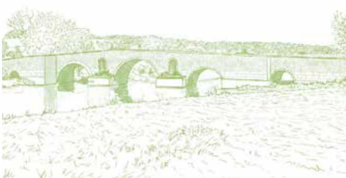
Puente romano sobre el arroyo Grande. Actualmente exhibe seis arcos, pero es posible que tenga seis arcos más enterrados por la sedimentación.

Este recorrido se caracteriza por su perfil casi llano y por el frecuente cruce de cursos de agua, características que hacen que sea un recorrido fácil y fresco. Desde el primer momento, el puente romano facilitó el cruce del Arroyo Grande. Las dehesas son densas y formadas por encinas de gran porte. Siguiendo por la margen derecha del arroyo del Cubo encontramos la fuente del Cubo y el puente del Cubo de origen incierto. Cruzamos a la otra orilla y más adelante encontramos las ruinas del molino del Cubo. Cambiamos de dirección y vamos al encuentro del arroyo del Freixo que cruzamos antes de que se junte al Arroyo Grande. Las galerías ribereñas son frondosas y densas. Siguiendo en dirección al noreste hasta el punto donde fue construido el puente llamado puente Velha. Aquí empieza nuestro regreso siguiendo a lo largo de la margen derecha del Arroyo Grande, que cruzamos por el puente de carretera integrado en un tramo abandonado de la EN18 y, de aquí hasta el fin, el recorrido se desarrolla a lo largo de terrenos agrícolas y olivares.