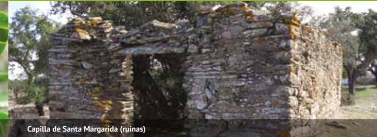
Capilla de Santa Margarida (ruinas)