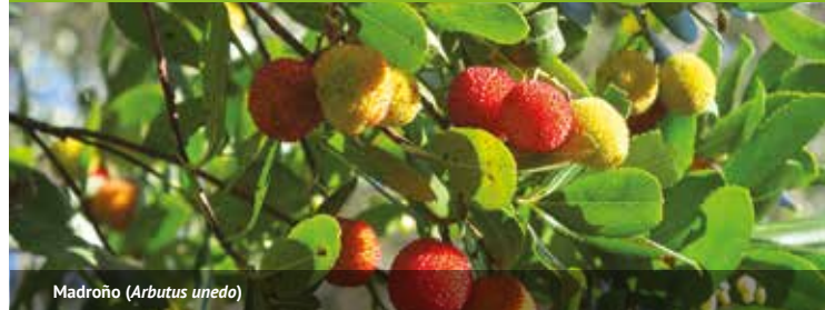
Madroño ( Arbutus unedo )