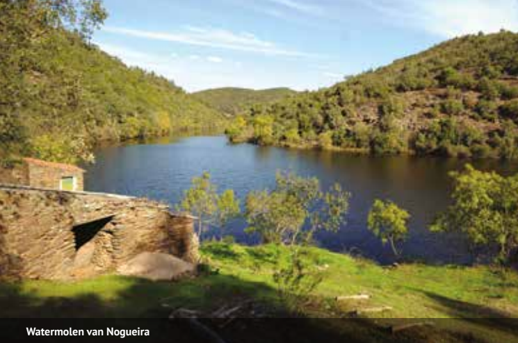
Watermolen van Nogueira