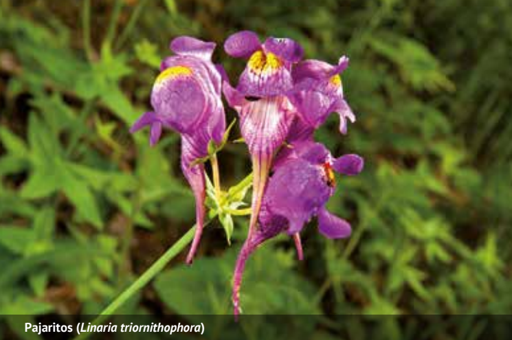
Pajaritos ( Linaria triornithophora )