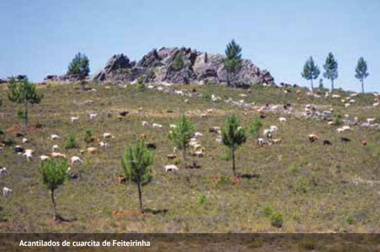
Acantilados de cuarcita de Feiteirinha