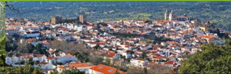
Uitzicht over Portalegre