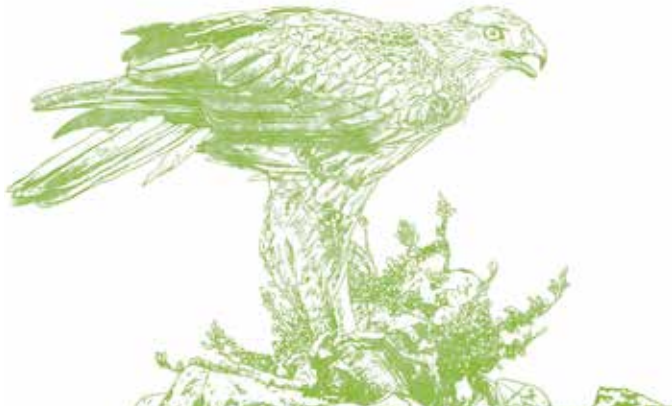
Havikarend ( Aquila fasciata ). De koningin van de lucht in de Alto Alentejo.

Deze route leidt ons door de omgeving rond Portalegre, langs de hoogste punten van het noordoosten. We komen uit bij panorama's over de stad die enkele van de meest vooraanstaande gebouwen onthullen, maar ook bij oude, ommuurde paadjes en smalle kasseiwegen tussen ontelbare landgoederen en kleine dorpjes.