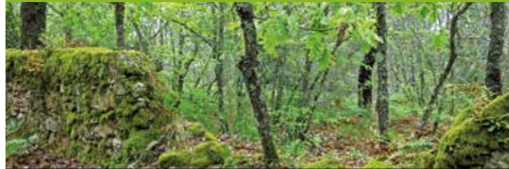
Eikenbos omringd door muren