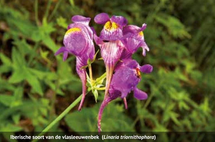
Iberische soort van de vlasleeuwenbek ( Linaria triornithophora )