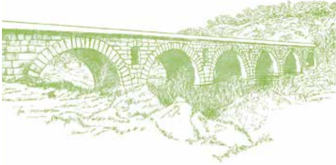
Puente romano de Vila Formosa - Monumento nacional. Fue construido a finales del siglo I/comienzos del siglo II d.C. Formaba parte de la vía que conectaba Olisipo (Lisboa) a Emerita (Mérida).

Seda es el pueblo que sirve de punto de partida para este recorrido. El atrio de la iglesia matriz, que está orientada hacia oeste, es como un mirador: al este, Alter do Chão y Alter Pedroso, al sur se avista Evoramonte y al oeste corre el arroyo Seda que nace hacia noreste, en la sierra de São Mamede que acompañaremos a partir de aquí. Aprovechemos para dar un paseo por el pueblo, encontrando los restos de sus viejas murallas, yendo hasta su extremo norte donde, junto a la Capilla de São João, otro espacio nos sirve de mirador. Bajamos por un camino empedrado hasta la margen izquierda del arroyo Seda, rodeada por el majestuoso bosque ribereño. Más adelante llegamos a la carretera fuera de uso que nos lleva al magnífico puente romano de Vila Formosa. Volvemos a la margen del arroyo que muy pronto cruzaremos por un gran conjunto de piedras. Pasaremos por el puente de los Mendes, de pizarra, sobre el arroyo Alfeijós, de origen incierto, pero cuyas características actuales indican que pertenece a la época medieval.