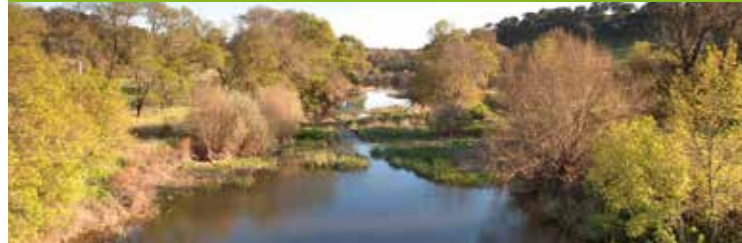
Arroyo de Seda