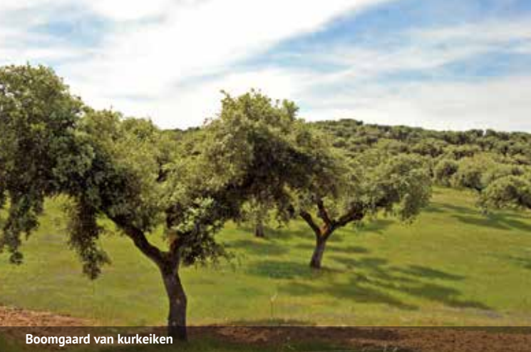
Boomgaard van kurkeiken