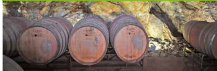
Monte da Esperança - wijnkelder en plattelandstoerisme