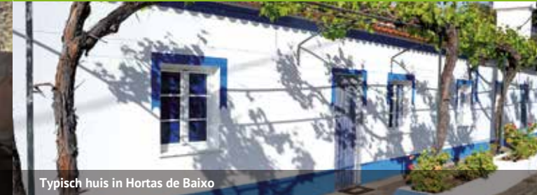
Typisch huis in Hortas de Baixo