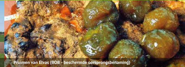
Pruimen van Elvas (BOB - beschermde oorsprongsbenaming)