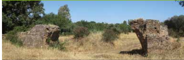
Ruïnes van de Romeinse brug