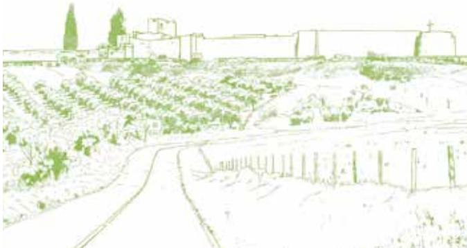
Kasteel van Ouguela. Bovenop een kleine helling behoudt het oude kasteel, en daarna fort, haar waakzame karakter.

Aan het begin van deze route staan de zeldzame huizen van Ouguela, het kasteel en het fort dat er later aan toegevoegd werd. Ter voorbereiding van deze wandeling bekijken we het mooie landschap dat zich voor ons uitstrekt voordat we het kasteel bezoeken. We bedwingen onze nieuwsgierigheid niet langer en bekijken de cisterne en het huis van de Governador binnenin het kasteel en de bron van Ouguela aan de buitenkant. Daarna vertrekken we richting het westen waar we de wachttoren van S. Pedro vinden. De toren wordt gecamoufleerd door een traditionele olijfgaard en was een belangrijk verdedigingspunt van het fort. Nu dalen we de heuvel af richting de oevers van de rivier van Abrilongo waar we kunnen oversteken via de vele platte rotsen die hier verzameld liggen. We lopen stroomafwaarts langs de galerijbossen tot de stroom zich verbreedt in de rivier Xévorá. Er is bijna niets meer over van de oude Romeinse brug. Maar een nieuwe oversteek laat ons een bezoek toe aan de Heiligdom Nossa Senhora da Enxara. Op de terugweg naar Ouguela lopen we langs het milieucentrum van Xévorá. Dit gebouw werd vroeger gebruikt als grenspost om mensen en handelswaar te controleren.