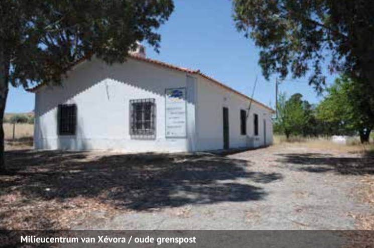
Milieucentrum van Xévoira / oude grenspost