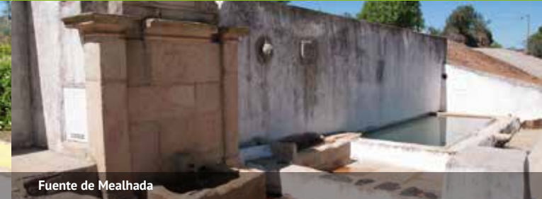
Fonte de Mealhada