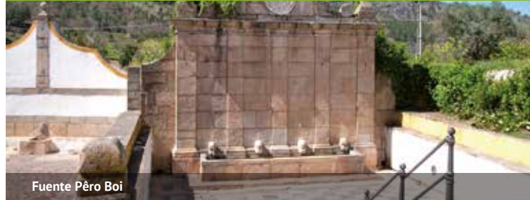
Fonte Pêro Boi