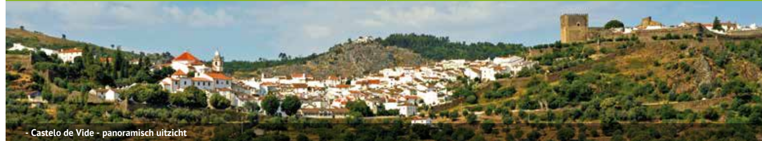
- Castelo de Vide - panoramisch uitzicht