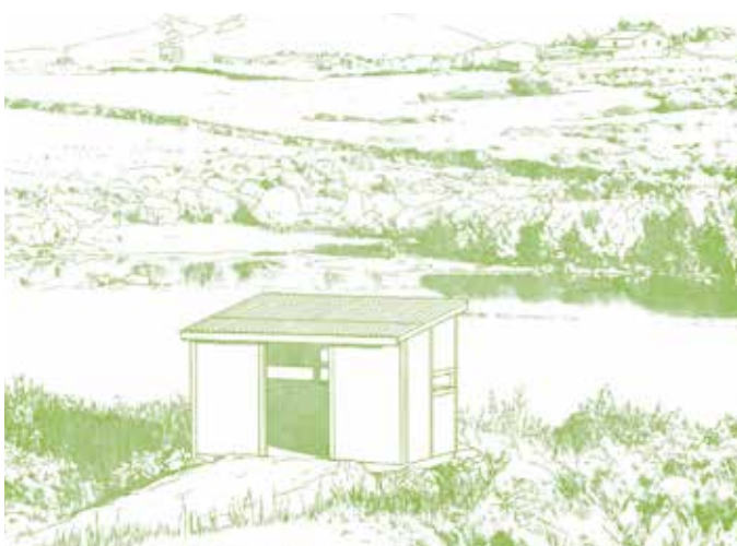
Een van de twee observatoria op de route: langs de oevers van het stuwmeer van Póvoa lopen met onze blik op de vogels.

Met de aanleg van de stuwdam van Póvoa werd een stuwmeer gecreëerd van 236 ha. Onze route loopt deels om dat meer heen. We beginnen bij het camperterrein en al snel komen we bij de dodenstad van Boa Morte, een oude begraafplaats die een voorbeeld is van de archeologische rijkdom van dit gebied. Bij de toegang tot de dam brengen we eerst nog even een bezoekje aan de watermolen en het oude ronde bouwwerk dat dienst deed als plek om te schuilen, of tijdelijk te wonen, voor landarbeiders. Beide getuigen van de landbouwactiviteiten die hier werden uitgeoefend. Aan het eind van de dam gaan we lopen op de hoogte tot waar het water komt als het stuwmeer maximaal gevuld is. Als we dicht bij de gemeentelijke weg zijn, zien we in de berm een goed geconserveerd graf waarvan de opening een mensvormige omtrek heeft. We blijven de oever volgen tot we bij een vogelobservatorium komen. Tijd om onze verrekijker uit de rugzak te halen. Vanaf hier verwijderen we ons enigszins van het stuwmeer en doorkruisen we een gebied met eiken, waar her en der graniet opduikt in de vorm van rotsen, losse steentjes of netjes opgestapelde stenen muurtjes. Het laatste deel van de route gaat over een goed begaanbare zandweg en we eindigen bij een tweede observatorium, waar we afscheid nemen van het stuwmeer en zijn vogels.