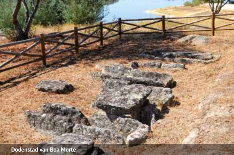
Dodenstad van Boa Morte