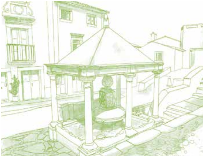
Stadsfontein. Deze bijzondere bezienswaardigheid van Castelo de Vide dateert uit de tijd van koning João III.

De talloze fonteinen van Castelo de Vide en omgeving getuigen van de enorme rijkdom aan waterbronnen in deze streek. De route begint bij de begraafplaats en loopt door de wat drukkere delen van het stadje, en leidt u langs de mooiste plekken en verborgen hoekjes. Hier vindt u de meest monumentale en vanuit cultureel oogpunt belangrijkste fonteinen. Daarna loopt u naar het lager gelegen gebied aan de rand van het stadje, bij de rivier van São João, waarlangs landbouwgronden, boerderijtjes en tuinen liggen. Hier wordt het ons duidelijk dat de fonteinen niet alleen plaatsen waren waar mensen water kwamen halen, maar dat ze daarnaast ook dienden om het vee te laten drinken en om er de was te doen. Van hieruit wordt ook water doorgeleid om het land te irrigeren, en wat er overblijft vindt zijn weg naar de dichtstbijzijnde stroom. De route loopt om Castelo de Vide heen, over smalle en door muurtjes geflankeerde weggetjes met middeleeuwse bestrating, waarna we weer het stadje ingaan door een van de oude poorten in de muur, de Poort van São Pedro. We bevinden ons nu in het oudste deel, en steken de hoofdstraat van de ommuurde citadel over, de Rua Direita. We gaan weer het stadje uit door de stadspoort, en lopen van fontein tot fontein door de oude Joodse wijk. Het hoogtepunt van de route is de "Stadsfontein", maar de route loopt nog verder door, langs enkele van de voornaamste plekken van het stadje.