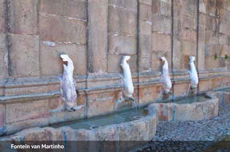
Fontein van Martinho