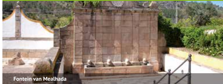
Fontein van Mealhada