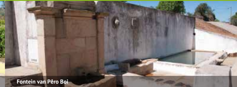
Fontein van Pêro Boi